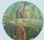
LE BROCHET DU 1 ER MAI AU 28 JANVIER