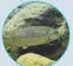
LA TRUITE FARIO DU 10 MARS AU 18 SEPTEMBRE