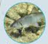
LE CHEVESNE TOUTE L'ANNÉE