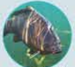
LA CARPE TOUTE L'ANNÉE