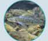
LE SANDRE DU 1 ER MAI AU 28 JANVIER