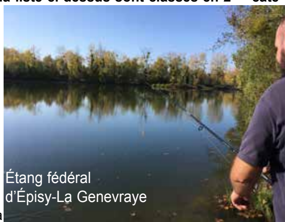
Étang fédéral d'Épisy-La Genevraye