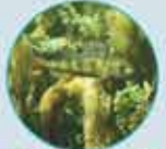
LA PERCHE COMMUNE TOUTE L'ANNÉE