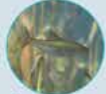
LE GARDON TOUTE L'ANNÉE