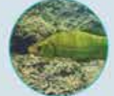
LA TANCHE TOUTE L'ANNÉE